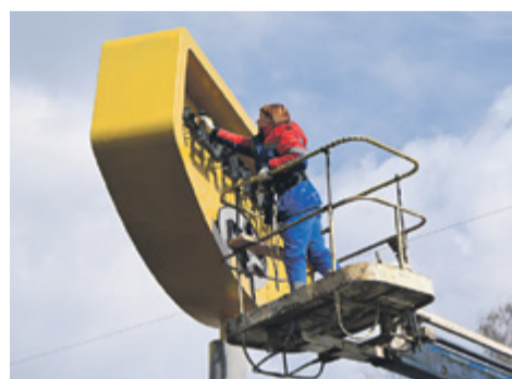
Реконструкция стелы Варкауса, Петрозаводск