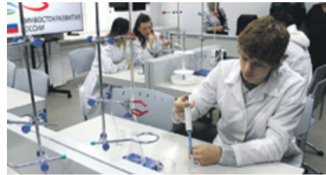
Новые площадки оснащены по последнему слову техники, чтобы выпускники имели навык работы по специальности

ки технологического процесса очистки природных и сточных вод; • лаборатория проектирования систем водоснабжения и водоотведения. Все перечисленное соответствует последнему слову техники, чтобы выпускники приходили на работу, уже имея соответствующие навыки. ◆