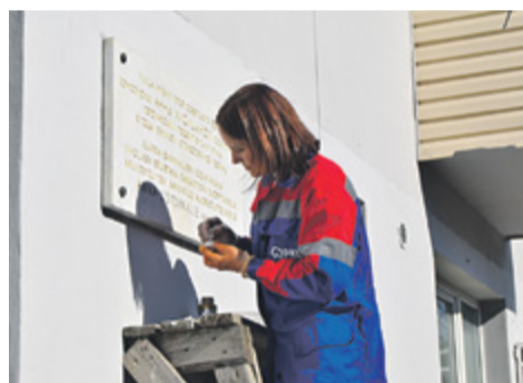
Реконструкция таблички на ул. Лисицыной к 9 Мая, Петрозаводск

где каждая цифра важна для жизнеобеспечения города.