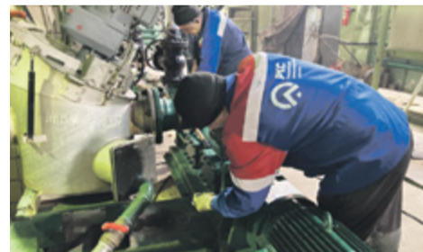
50 лет водоканалу

Приказом № 23 от 19 января 1976 года по НГДУ «Мегионнефть» было создано управление водоснабжения и канализации города Нижневартовска. Сегодня «Нижневартовские коммунальные системы» работают в рамках трехсторонне-