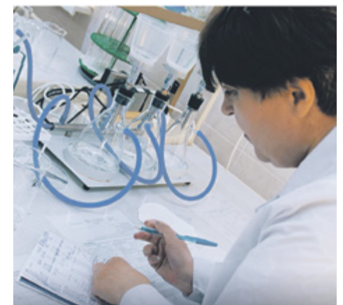
Лаборатория водоснабжения ООО «Ульяновскоблводоканал»

Кроме того, расширен диапазон определения ортофосфатов: если ранее исследования проводились при концентрации от 0,4 мг/дм 3 , то теперь лаборатория способна выявлять этот показатель начиная с 0,1 мг/дм 3 . ◆