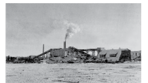
Котельная в районе Соломенное

Общий объем вложений за последние годы превысил 1,7 млрд рублей, а в перспективе до 2051 года планируется направить около 4 млрд рублей.