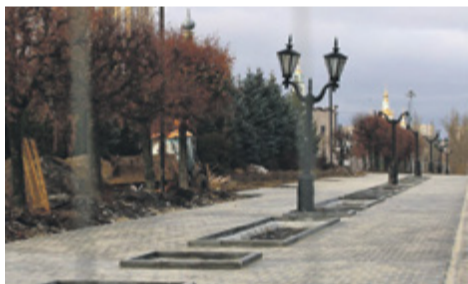
Реконструкция коллектора между улицами М. Горького и С. Рахманинова, осень 2025 года

Коллектор функционирует, транспортировка стоков проходит через новые коммуникации.