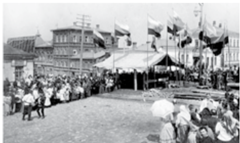
Открытие водопровода в Самаре, 1886 год

Наши предприятия празднуют свои юбилеи. За десятилетия в Самаре, Петрозаводске и Нижневартовске структуры РКС стали признаком стабильности и развития.